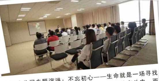
南昌分公司专题演讲：不忘初心——生命就是一场寻找初心的旅程，也是一部绽放生命不断拼搏的奋斗史，而科睿特将是成就你我他的大舞台。