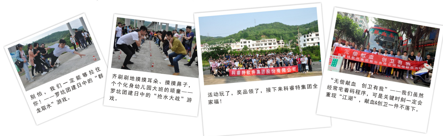
别怕，我们一定能够拉住你！——罗坑团建日中的“群龙取水”游戏。

今年以来，公司在企业文化建设工作中，坚持把价值理念深入到企业“毛细血管”，通过开展户外拓展、主题演讲、部门座谈等丰富多彩的活动，将价值理念的“抽象语言”内化成基层员工易接受、觉亲切、便践行的“行为语言”，推动“以奋斗者为本”价值观深度融合与协同，紧密员工与企业间的情感纽带关系，激发和调动集团广大职工的工作积极性和创造性，共同奋力追赶新时代、谱写新征程。