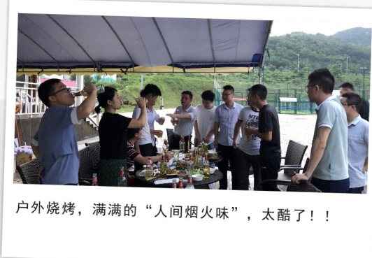
户外烧烤，满满的“人间烟火味”，太酷了！！