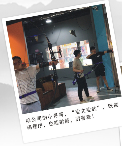
咱公司的小哥哥，“能文能武”，既能码程序，也能射箭，厉害着！