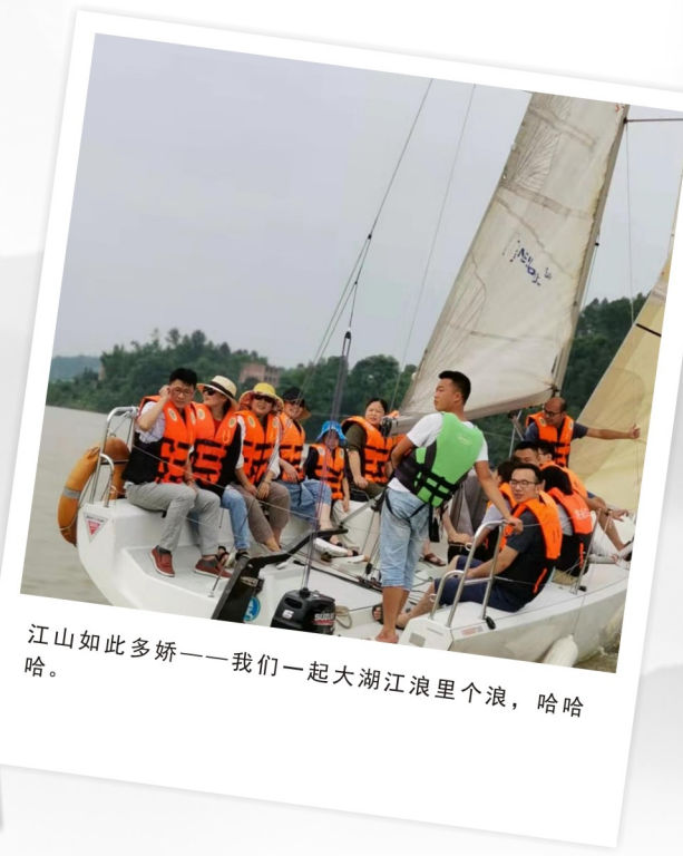
江山如此多娇——我们一起大湖江浪里个浪，哈哈。